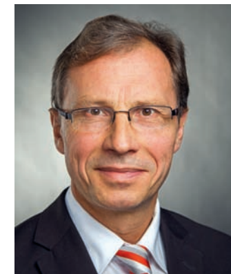
Freundliche Grüße, Ihr